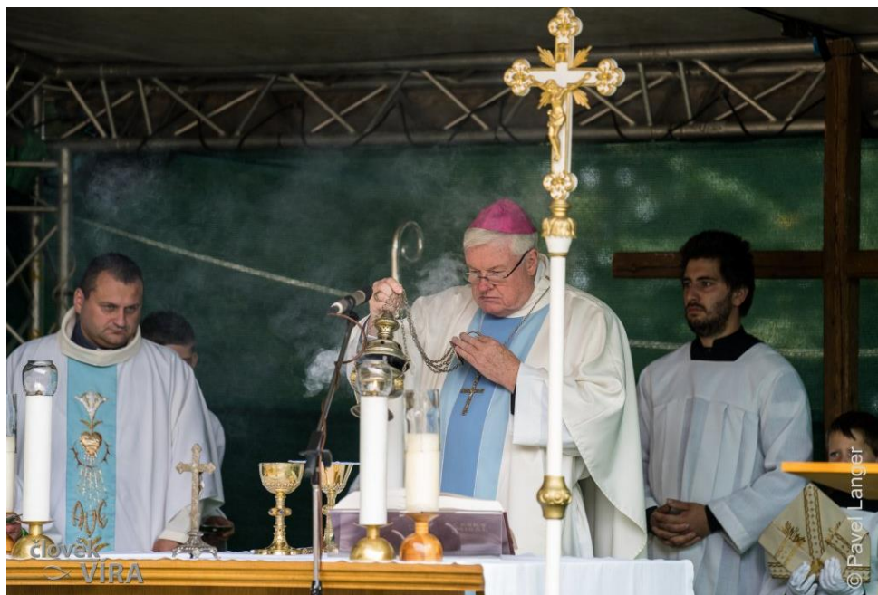
Poutní slavnost na Mariánské Hoře (neděle 12. 9. 2021)