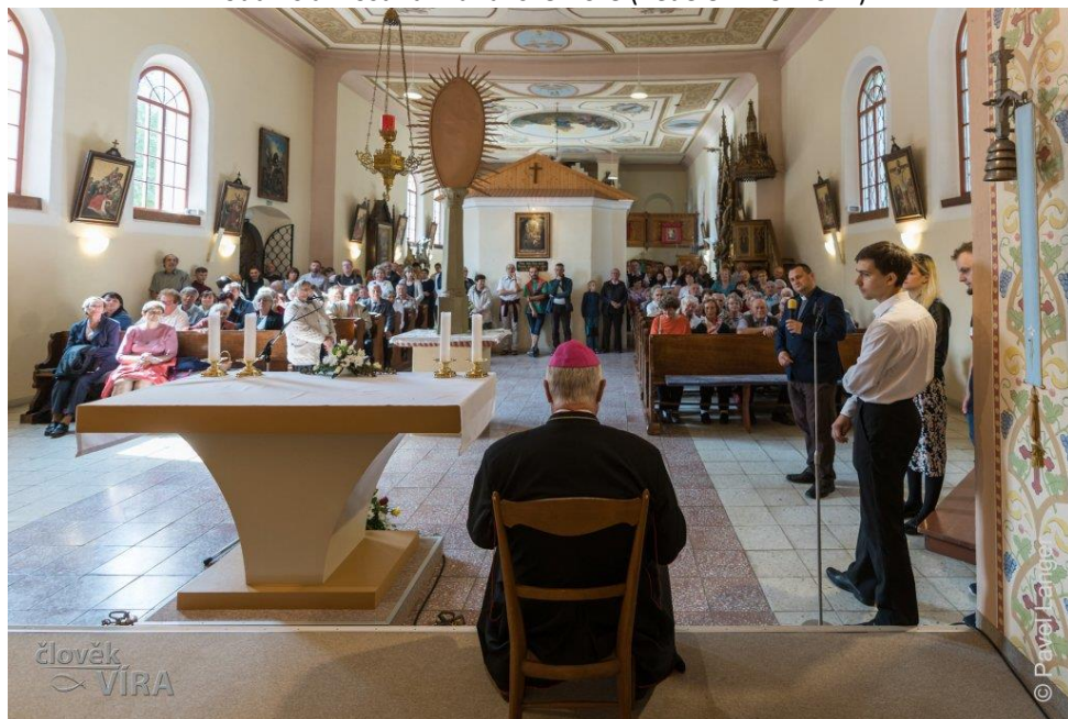
Poutní slavnost na Mariánské Hoře (neděle 12. 9. 2021)