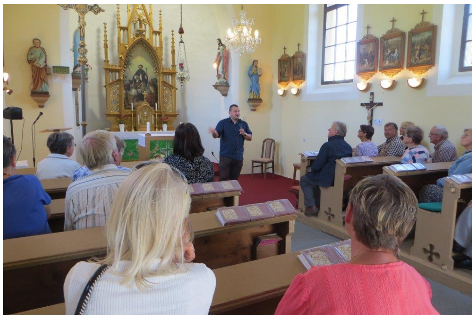
Návštěva bývalých farníků z Červeného Kostelce (9. 9. 2021)