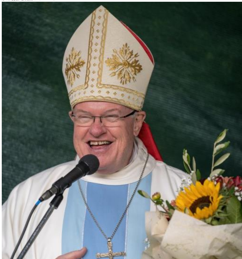
VERAŽOVICE SV. JÁN KŘTIEL