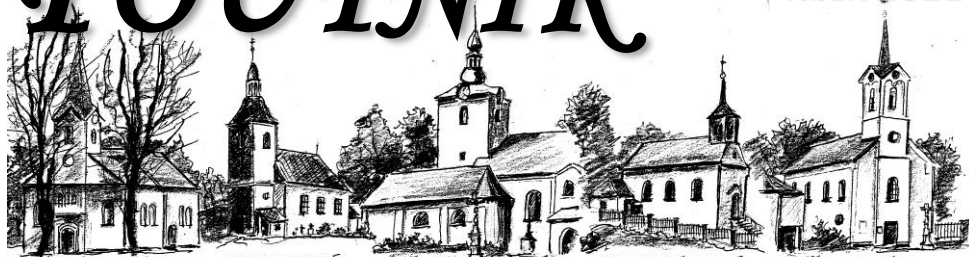
HOŘANŮ ŽERMANŮ - MARIEHOLE HORA POUTNÍ KOSTEL - NAROZENÍ P. MARIE